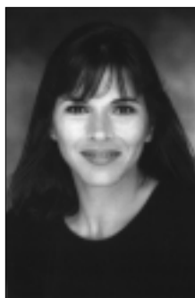
D'une campagne à l'autre, le CQTS a pu compter sur des porte-parole passionnés et éloquents pour donner une visibilité importante à la Semaine québécoise pour un avenir sans tabac. La comédienne et animatrice Mireille Deyglun a joué ce rôle avec générosité, enthousiasme et conviction au cours des campagnes de 2001 et 2002.

1999 – Trois déjeuners-conférences sont organisés, avec l'appui financier de Glaxo Wellcome, pour favoriser l'application de la Loi sur le tabac . Cet événement connaît un succès inespéré puisque plus de 500 dirigeants d'entreprises y participent avec intérêt.