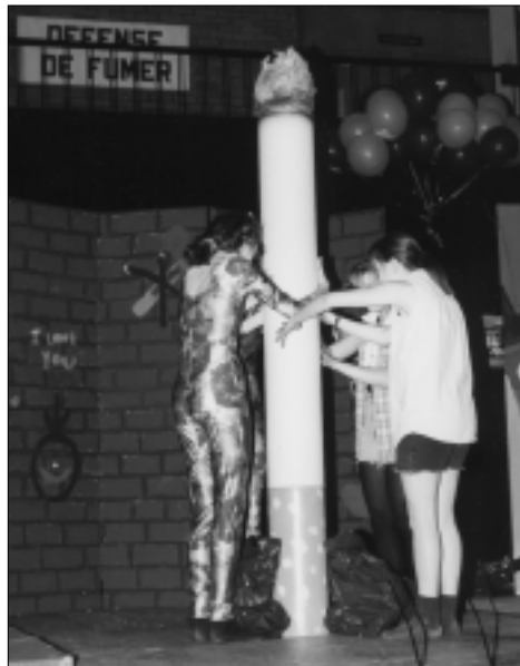
Forum de La gang allumée à Québec en 1997

La gang allumée pour une vie sans fumée jouit d'une renommée qui va en s'intensifiant. N'en déplaise aux faiseurs d'images qui associent le tabac à des individus et comportements enviables depuis des décennies, un nombre grandissant de jeunes affichent fièrement leur statut de non-fumeur.