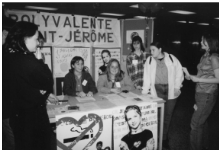
Premier forum de La gang allumée au Cégep Ahuntsic

Entre 1995 et 2002, les membres de La gang allumée ont réalisé plus de 1 000 projets sur le thème du tabagisme : des chorégraphies, pièces de théâtre, improvisations, dessins, sondages, sites Internet, défis 24 heures pour cesser de fumer, stands d'information, concours de dessin, émissions de radio étudiante, chansons, poèmes et génies en herbe, pour ne nommer que ceux-là.